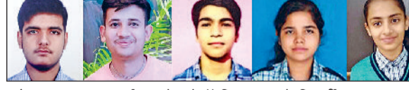
फतेहाबाद। शानदार प्रदर्शन करने वाले पॉयनियर स्कूल के विद्यार्थी।