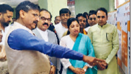
प्रदर्शनी का कैबिनेट मंत्री ने अवलोकन करते हुए कहा कि इस प्रदर्शनी के माध्यम से आमजन को सरकार की महत्वपूर्ण जन कल्याणकारी योजनाओं के बारे में जानकारी दी जा रही है। सूचना,