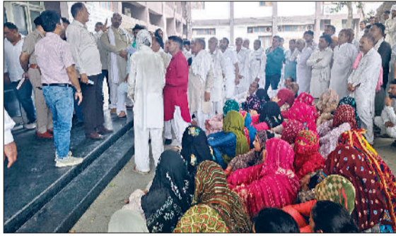
फतेहाबाद। लघु सचिवालय के बाहर प्रदर्शन करते जाण्डली खुर्द के किसान व डीसी से मिलने आए गांव जाण्डली के किसान।

नहरी पानी से वंचित गांव जाण्डली खुर्द से पड़ोस के गांव चन्द्रावल के कुछ किसानों द्वारा अंडरग्राउंड पाइप लाइन बिछाकर खेतों की सिंचाई के लिए पानी ले जाने के मामले में गांव जांडली कलां के किसान उग्र हो गए हैं। इस मामले को लेकर सोमवार को गांव के सैकड़ों किसान एकत्रित होकर लघु सचिवालय पहुंच गए और एडीसी को ज्ञापन सौंपकर पाइप लाइन बिछाने पर प्रतिबंध लगाने की मांग की। किसानों का कहना है कि जांडली गांव अनकमांड एरिया में आता है। किसान यहां पर सबमर्सीबल ट्यूबवेल से सिंचाई करते हैं। यही कारण है कि यहां का भूजल स्तर 50 फुट से गिरकर 225 फुट तक चला गया है। एडीसी अनुरूप जांडली न किसानों को इस मामले में उचित कार्रवाई करने का आश्वासन दिया। एडीसी से मिलने