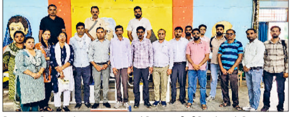
सिरसा। हरियाणा कौशल अध्यापक एसोसिएशन की मीटिंग में पहुंचे शिक्षक।