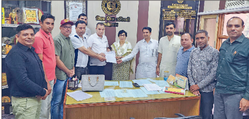
फतेहाबाद। डीईओ को ज्ञापन सौंपते राजकीय प्राथमिक शिक्षक संघ के पदाधिकारी।

राजकीय प्राथमिक शिक्षक संघ के पदाधिकारियों ने जिला