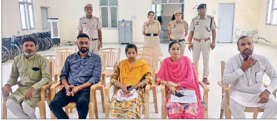
जाखल। ब्लॉक समिति के चेयरमैन व वाइस चेयरमैन के चुनाव को लेकर बैठक में पहुंचे सदस्य।