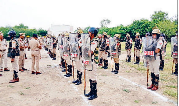
फतेहाबाद। मॉक ड्रिल में भाग लेते पुलिस कर्मचारी।